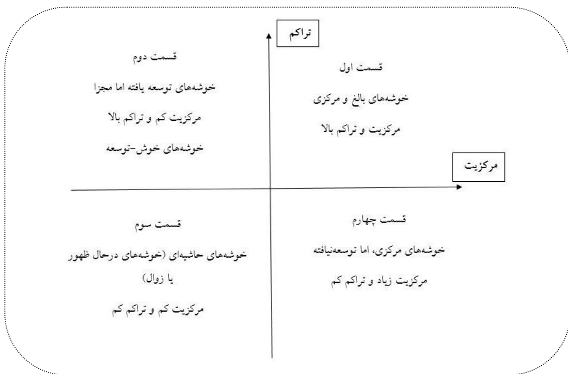
شکل ۱. بخش‌های چهارگانه یک نمودار راهبردی (هو و دیگران، ۲۰۱۳)

در یک نمودار راهبردی، اگر مرکزیت یک خوشه موضوعی بالاتر باشد بر این دلالت می‌کند که آن خوشه از جایگاه مهم‌تری در حوزه پژوهشی برخوردار است. از سوی دیگر، اگر تراکم خوشه‌ای بیشتر باشد نشان‌دهنده بلوغ و قابلیت بیشتر آن حوزه است. در نتیجه می‌توان در یک نمودار راهبردی، محور X را به عنوان مرکزیت رتبه و محور Y را دلالت‌کننده بر تراکم دانست. یعنی اگر نمودار راهبردی مطابق شکل ۱ به چهار قسمت تقسیم شود، خوشه‌های قرارگرفته در هر قسمت بر اساس میزان مرکزیت و تراکم وضعیت متفاوتی دارند. قسمت اول بیانگر خوشه‌های بالغ و مرکزی است که در مرکز مطالعات حوزه مورد نظر قرار دارد که حاوی مرکزیت و تراکم بالایی هستند. قسمت دوم