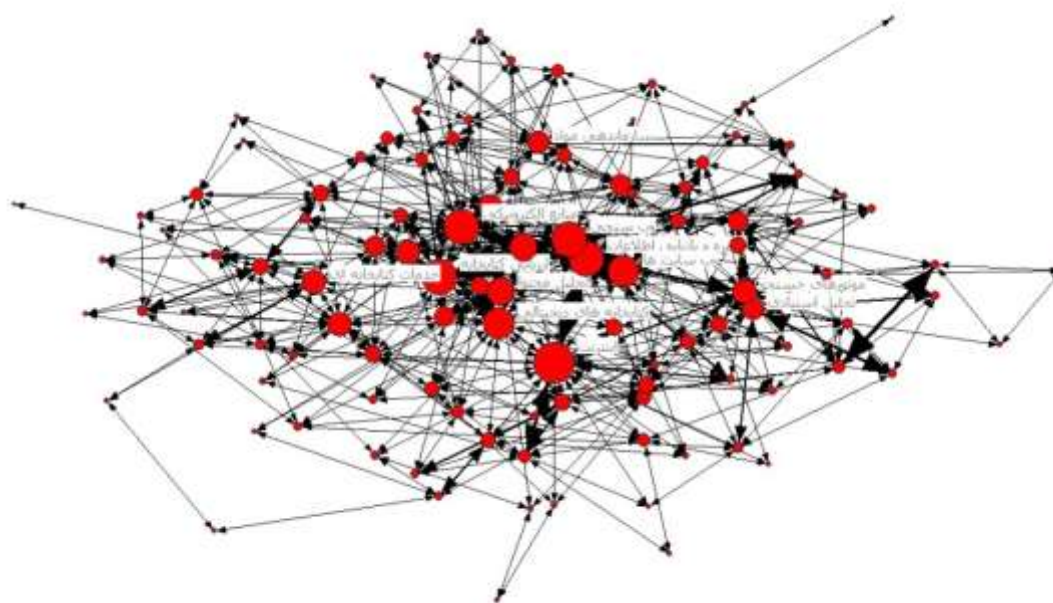
نقشه ۱. نقشه هم‌واژگانی مقالات بر اساس شاخص مرکزیت رتبه

همانگونه که جدول نشان می‌دهد مقادیر مرکزیت رتبه مربوط به کلیدواژه‌های برتر به ترتیب، وب سنجی، اینترنت، و ارزیابی کتابخانه است. در ادامه نقشه هم‌واژگانی بر اساس مرکزیت رتبه ترسیم شده است. در ادامه، نقشه هم‌واژگانی مقالات با توجه به شاخص یادشده و به‌منظور بررسی ساختار هم‌واژگانی مقالات مستخرج از پایان‌نامه‌های علم اطلاعات و دانش‌شناسی ترسیم شده است (نقشه ۱).